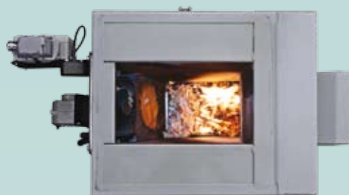
IWABO X-50 Flisugn

Exempel: Ett förråd som är 2 x 2 meter kan skruven utanför förrådet max vara 4 meter.